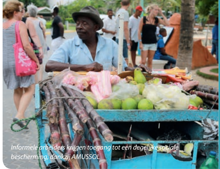
Informele arbeiders krijgen toegang tot een degelijke sociale bescherming, dankzij AMUSSOL

In de praktijk regelt de grote meerderheid van het aangesloten huispersoneel de aansluiting via hun vakbond. Het is voor hen immers zeer moeilijk om met de werkgever in discussie te treden en hem te overtuigen om 70% van het bedrag van de sociale bijdrage te betalen. Bovendien zijn het meestal de vertegenwoordigers