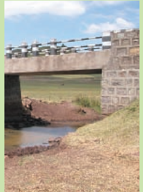
Een mooi liedje van Simon & Garfunkel. In Ethiopië een realisatie van OSRA.

Tijdens het regenseizoen is het beekje een hard stromende rivier. De bewoners van de ene kant van het dorp konden niet meer weg. Dankzij de brug is de graanbank, de dierenkliniek, de markt,... alles terug bereikbaar.