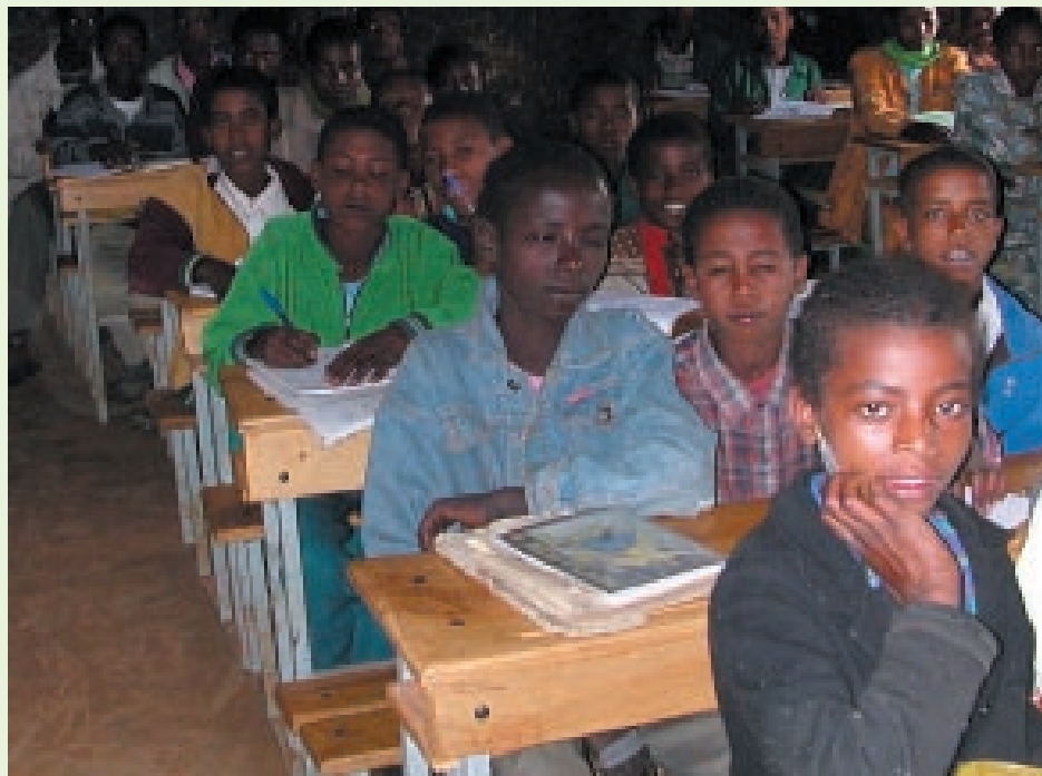
Ook voor schoolbanken werd gezorgd. Rechtstaand of zittend op de grond les volgen is niet zo evident.