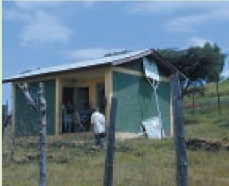
Klein en bescheiden gebouwtje.

OSRA en HUNDEE brengen mensen samen. Geven hen vorming. Een duwtje in de rug zodanig dat hun levensomstandigheden er stap voor stap beter op worden. Maar gezamenlijk één probleem oplossen, brengt meestal andere problemen aan het licht. OSRA en HUNDEE pakken ook die problemen aan. We stellen jullie hier kort nog enkele andere gerealiseerde projecten voor.